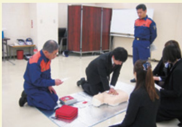
大規模災害を想定した防災訓練の様子