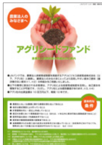
「アグリシードファンド」チラシ

農業法人の皆様への資金調達手段の一つとして、財務の安定化と対外信用力の向上等をご支援するため、アグリビジネス投資育成(株)と連携し、「アグリシードファンド」や「担い手経営体応援ファンド」による資本供与を提案しています。