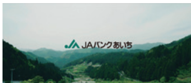
CM「未来が実る、農業へ。」編