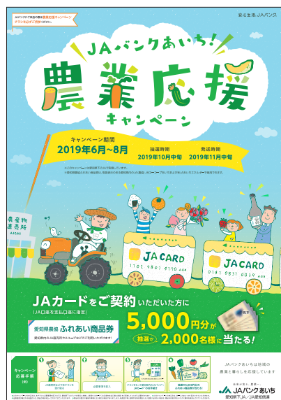
「JAバンクあいち！農業応援キャンペーン」ポスター

このキャンペーンは、県内JAが運営する農産物直売所やグリーンセンター、Aコープ等の経済事業店舗で配布される応募用紙を信用事業店舗の店頭にご持参のうえ、JAカードをご契約された個人のお客様を対象に、特典として、抽選で農産物直売所等の経済事業店舗で使用できる「愛知県農協ふれあい商品券」5,000円分を、2,000名のお客様に贈呈します。