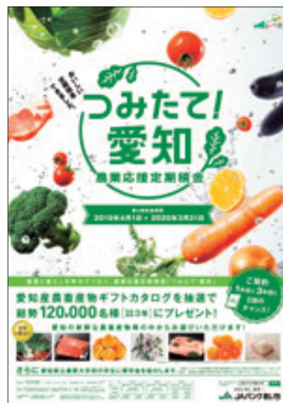
「つみたて！愛知」ポスター

平成30年度については、平成29年度の「つみたて！愛知」(第1期)の取扱実績に基づき、総額238万円の奨学金を給付させていただくこととなり、平成30年8月6日(月)に厳正なる審査の結果、奨学生となられた5名に奨学金目録を贈呈しました。