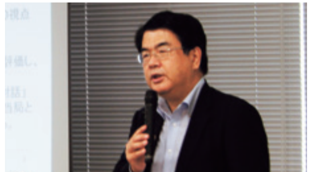
外部講師による役職員向けコンプライアンス研修会

また、コンプライアンスを実現するための具体的な実践計画（コンプライアンス・プログラム）を毎