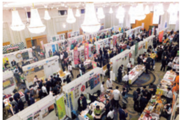
食と農の大商談会の様子