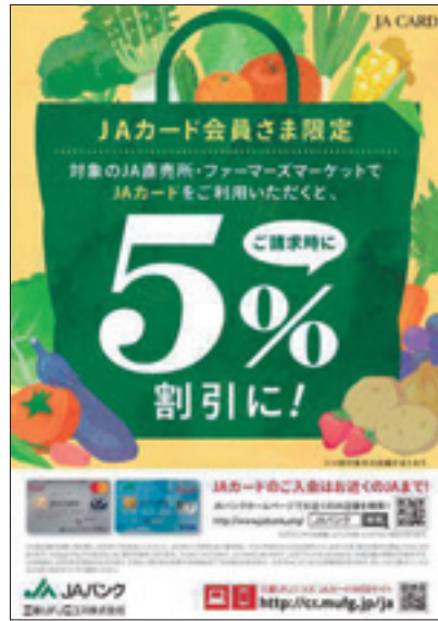
JAカード利用代金割引施策ポスター

愛知県内では、75か所（平成31年4月1日現在）の農産物直売所およびグリーンセンターが割引対象店舗となり、令和2年3月末まで、店頭でお買い物をされたお客様のJAカードご利用時のお買い物代金について、請求時に5%割引します。