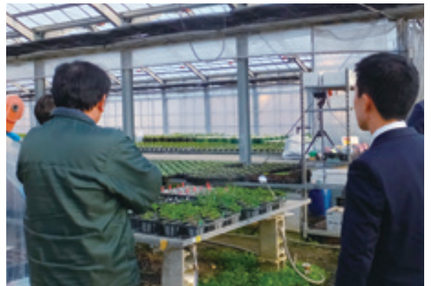
ビジネスマッチングの様子

このビジネスマッチングにおいては、農林中央金庫を始めとするJAグループとの連携を図りながら、ビジネスパートナーを幅広く紹介しています。