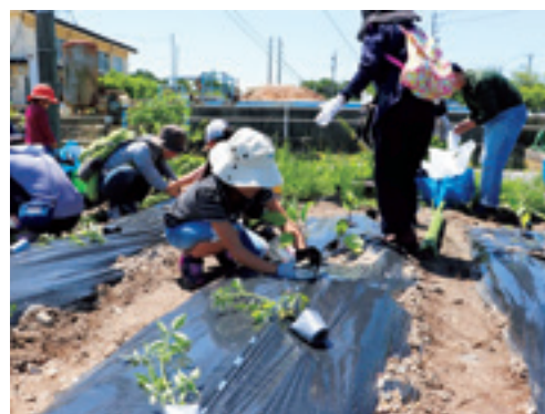
食農教育活動の風景

JA等が行う子どもに対する食農教育・環境教育等をテーマとした活動への支援を通じて、農業や自然環境等に対する理解の促進を図りました。