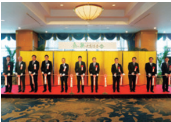
オープニングセレモニーの様子

当日は、1,000名を超えるバイヤーの方にご来場いただき、活発な商談が行われるとともに、来場者の新たな交流・情報交換の場として成果を上げることができました。