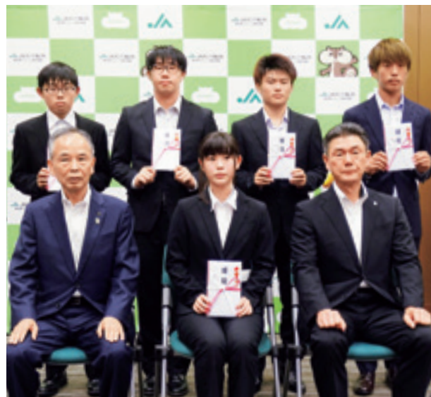
奨学金目録贈呈式