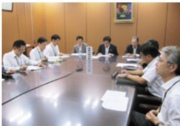
障害復旧訓練中の障害対策本部

この訓練は、重大な障害発生時の体制に万全を期するため、①当会内に設置する障害対策本部・支部の組織体制、②J A ・当会間および当会の部署間にかかわる情報連絡体制、③オンライン停止中の窓口・A T M対応、ならびに④J A S T E Mシステムおよび県センターシステムの障害復旧対応などの確認を目的に実施しています。