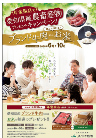
「年金振込で愛知県産農畜産物プレゼントキャンペーン」ポスター

令和3年度につきましては、令和3年6月から10月の期間を対象に、一部特典内容を変更のうえ実施しています。