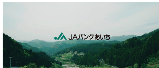
CM「未来が実る、農業へ。」編