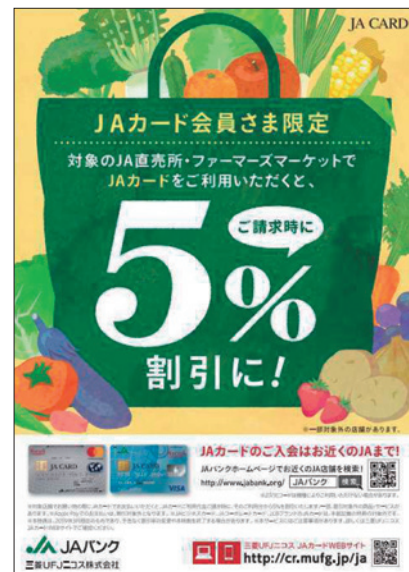
J A カード利用代金割引施策ポスター

愛知県内では、81か所（令和3年4月1日現在）の農産物直売所およびグリーンセンターが割引対象店舗となり、令和4年3月末まで、店頭でお買い物をされたお客様のJAカードご利用時のお買い物代金について、請求時に5%割引します。