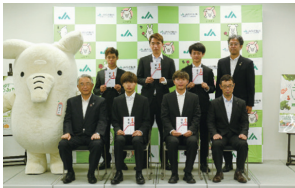
奨学金目録贈呈式

28日（金）に厳正なる審査の結果、奨学生となられた5名に奨学金目録を贈呈しました。