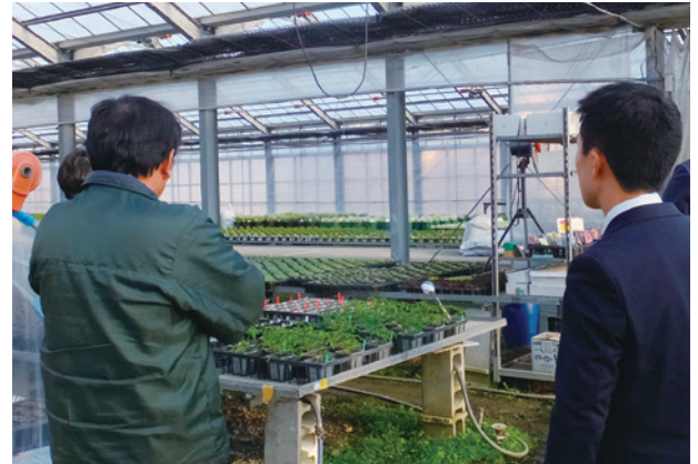
ビジネスマッチングの様子

このビジネスマッチングにおいては、農林中央金庫を始めとするJAグループとの連携を図りながら、ビジネスパートナーを幅広く紹介しています。