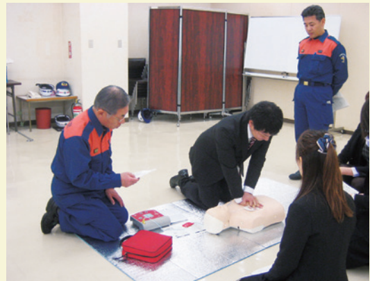
大規模災害を想定した防災訓練の様子